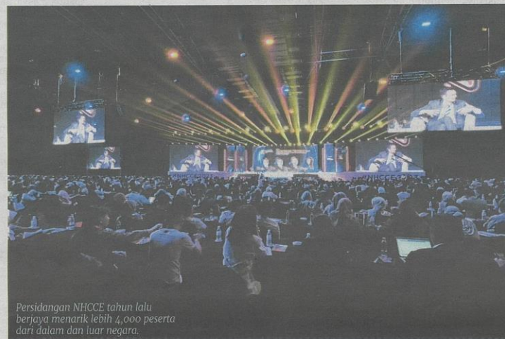
Persidangan NHCCE tahun lalu berjaya menarik lebih 4,000 peserta dari dalam dan luar negara.