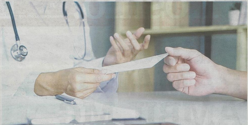
PERBUATAN menipu sijil cuti sakit merupakan satu kesalahan serius dan pekerja yang didapati bersalah boleh dibuang kerja serta-merta.

"Ada juga dalam kalangan penjawat awam selalu beri alasan penat sebab perlu memandu dalam tempoh lama semasa cuti dan mereka memerlukan tambahan rehat. Sebab itu ada yang